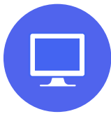
Laptop o PC

Estos requerimientos son obligatorios para poder rendir las evaluaciones de Ingreso Directo con el sistema de videovigilancia.