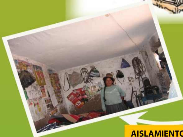
AISLAMIENTO DE TECHOS